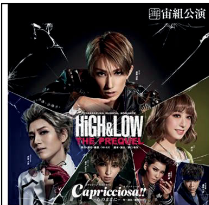
Immagine 3. Analisi paesaggio linguistico del genere testuale prodotti commerciale

Italianismo/pseudoitalianismo: ファッション・モストラーレ カプリチョーザ Capricciosa!!