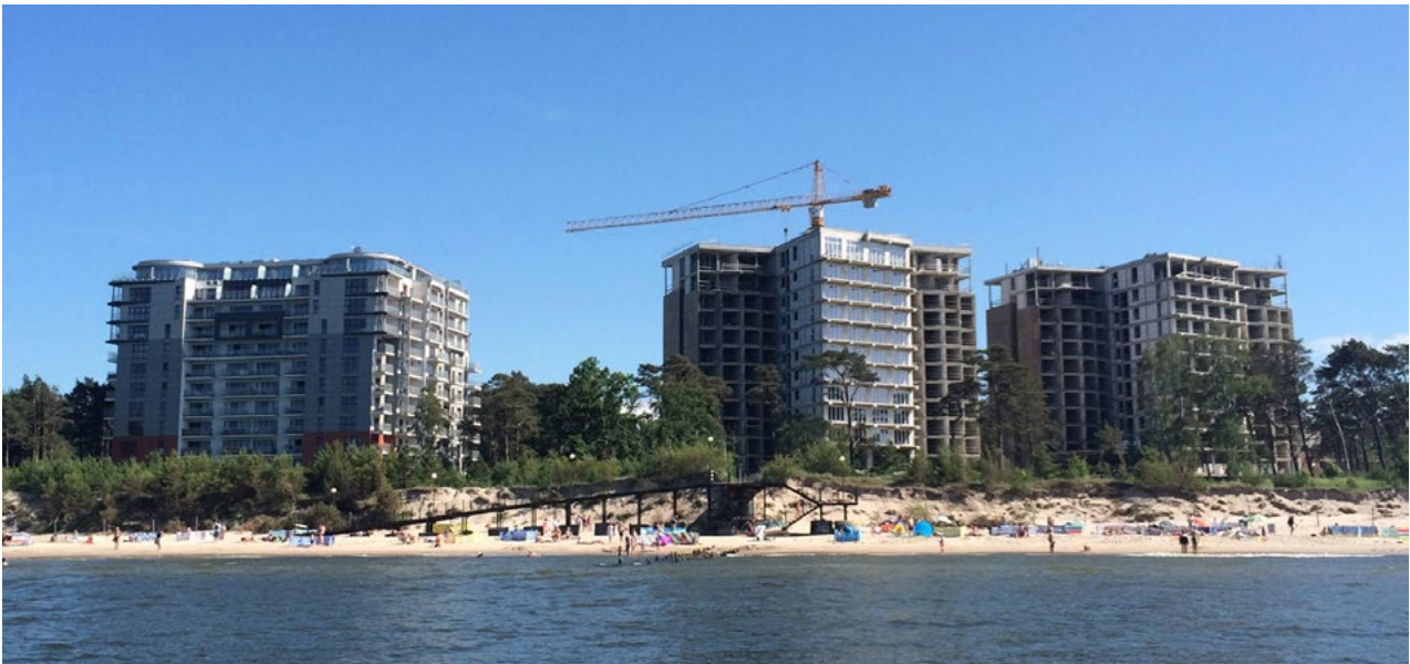
Il. 1. Dziwnówek, widok agresywnej zabudowy apartamentowej od strony morza.