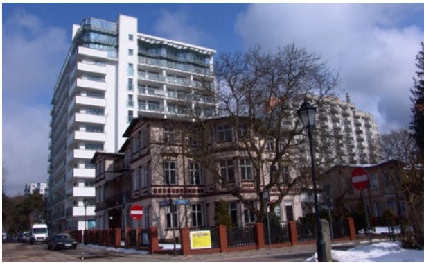
Il. 4. Międzyzdroje, kontrast starej zabudowy kurortowej usytuowanej przy promenadzie, z wypierającymi ją „szafami” apartamentowców. Jedynie szybki wpis do rejestru zabytków w roku 2000 uchronił obiekt i działkę od zakusów developerów.

Ill. 4. Międzyzdroje, the contrast of the old residential housing at promenade and the apartment buildings forcing them out. Only the quick entry into the register of historic monuments protected the building from the developer's attempts.