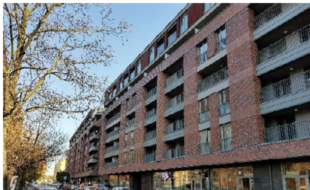
Il. 8. ATAL Residence, Kraków ul. Nadwiślańska 11. Fot. J. Gyrkovich – 2018

Ill. 7. Masarska 8, Apartamenty – Kraków. Phot. by Jacek Gyrkovich – 2018