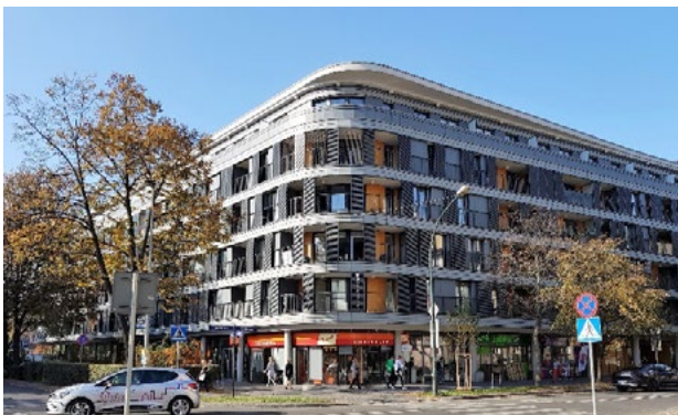
Il. 7. Masarska 8, Apartamenty – Kraków. Fot. J. Gyrkovich – 2018

Ill. 7. Masarska 8, Apartamenty – Kraków. Phot. by Jacek Gyrkovich – 2018