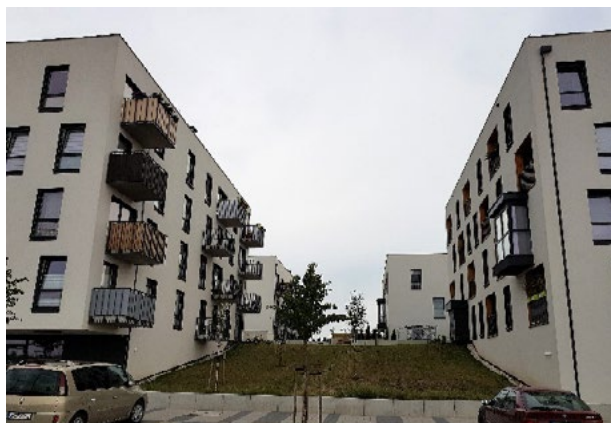
Il. 9, 10, 11, 12, 13, 14. Nowe Żerniki, Wrocław. Fot. J. Gyrkovich – 2018

Ill. 9, 10, 11, 12, 13, 14. Nowe Żerniki, Wrocław. Phot. by Jacek Gyrkovich – 2018