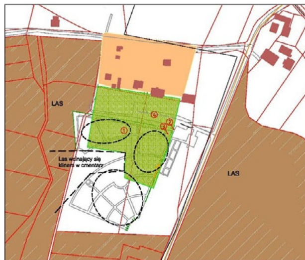
Il. 6. Schemat cmentarza komunalnego w Tychach (opracowanie G. Lasek) Legenda: 1. cmentarz; 2. brama wejściowo-wjazdowa na cmentarz; 3. krzyż; 4. parking

Ostatnim prezentowanym miejscem pochówku jest cmentarz komunalny w Tychach przy ulicy Barwnej założony na przedmieściach na przełomie XX i XXI wieku. Otoczony jest lasami pszczyńskimi. Dostępny jest od strony wschodniej, poprzez zjazd z drogi prowadzonej wzdłuż nekropolii. W sąsiedztwie głównej bramy wejściowo-wjazdowej zrealizowano parking. Miejsce lokalizacji nie posiada kontekstu sakralnego. Działka nekropolii wpisuje się w kształt nieregularnego prostokąta, w który – w sposób centralny – klinem wbija się niewielki las. Układ ścieżek zakomponowano w kształt wachlarza. Wydzielono w ten sposób kwatery na nagrobki. Niestety miejsce, w którym zbiegają się główne dojścia nie pokrywa się z lokalizacją głównej strefy wejściowej. Niepodkreślony dominantą punkt kulminacyjny dla układu ścieżek tworzących wachlarz znajduje się po przeciwnej stronie głównej strefy wejściowej. Zarazem obydwie zlokalizowane są w narożnikach wschodniej granicy parceli. W obrębie głównej strefy wejściowej zlokalizowano krzyż.