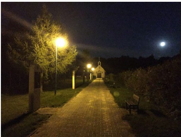
Il. 5. Widok oświetlenia prowadzącej na cmentarz alei, stacji drogi krzyżowej oraz kaplicy w Ławkach

Il. 5. The view of cemetery lane illumination, Stations of the Way of the Cross and a chapel in Lawki