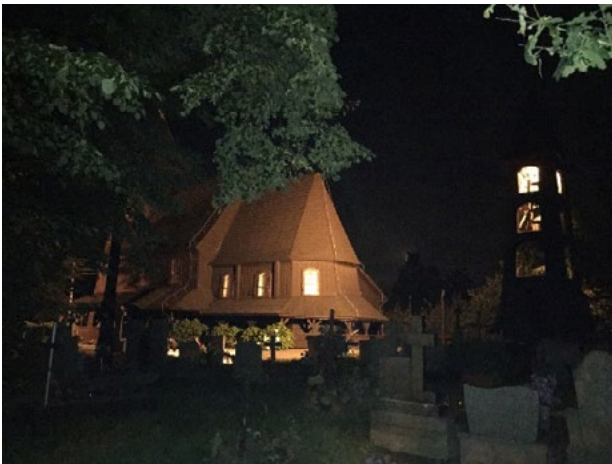
Il. 1. Oświetlenie kościoła parafialnego pw. Św. Barbary, dzwonnicy oraz cmentarza we wsi Góra.

Ill. 1. Illumination of the parish church under the invocation of St. Barbara with bell tower and cemetery in Gora.