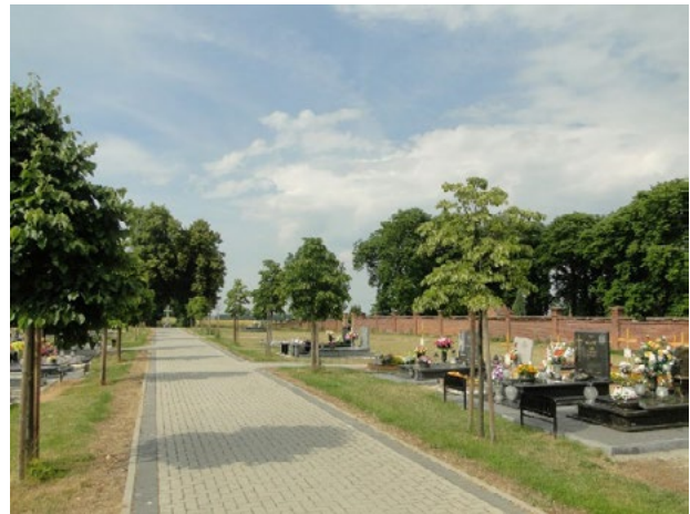
Il. 3. Widok cmentarza w Złotogłowicach. Jedna z głównych alej widoczna w całości. Druga aleja, zlokalizowana za murem rozdzielającym działkę, zaakcentowana jest układem drzew

Ill. 1. Illumination of the parish church under the invocation of St. Barbara with bell tower and cemetery in Gora.