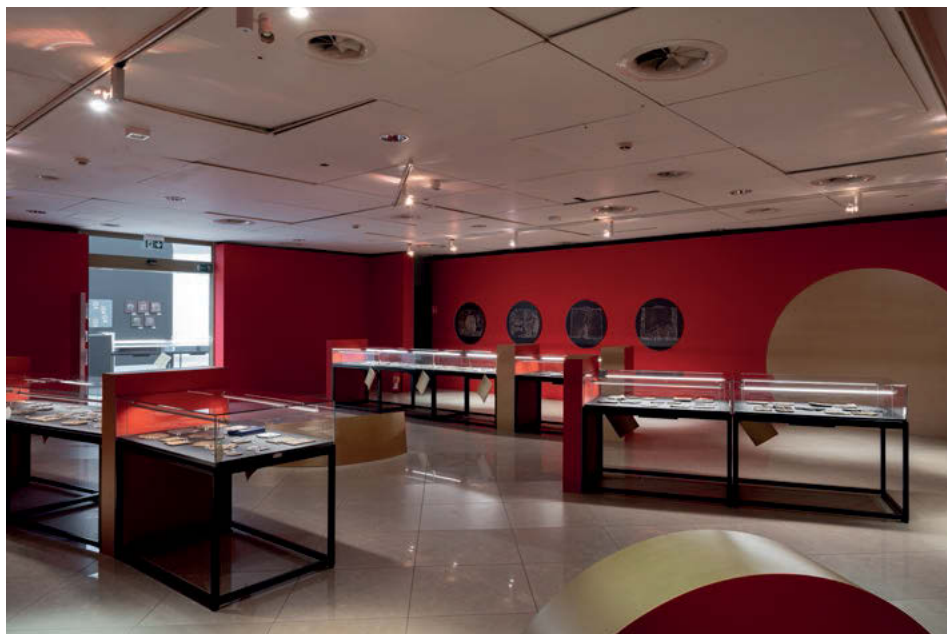
Wystawa Wielkopolska w monetach i medalach. Podróż przez tysiąclecie .

Twórczość artystów działających po 1945 r. została przedstawiona najobszerniej również dlatego, że medalierstwo w Poznaniu otrzymało wówczas silny impuls rozwojowy w postaci mecenatu