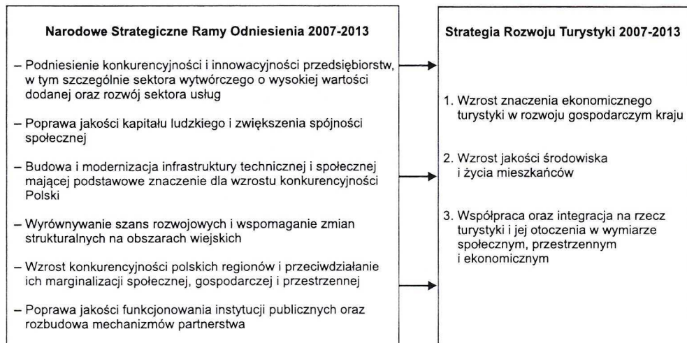
Ryc. 2. Powiązanie kluczowych celów Strategii Rozwoju Turystyki na lata 2007-2013 i celów horyzontalnych Narodowych Strategicznych Ram Odniesienia

a także priorytetów Strategii Rozwoju Kraju 2007-2015 , celu strategicznego Narodowych Strategicznych Ram Odniesienia 2007-2015 (Narodowa Strategia Spójności – NSS) oraz priorytetów Krajowego Programu Reform 2005-2008 .