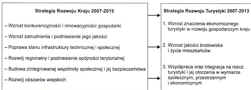
Ryc. 3. Powiązanie kluczowych celów Strategii Rozwoju Turystyki na lata 2007-2013 oraz priorytetów Strategii Rozwoju Kraju na lata 2007-2015

NSS nie poświęca turystyce odrębnej części, natomiast często odwołuje się do niej jako bardzo istotnego segmentu gospodarki, który przez swą interdyscyplinarność pobudza rozwój innych sektorów, wywołując wiele pozytywnych skutków rozpatrywanych na różnych płaszczyznach.