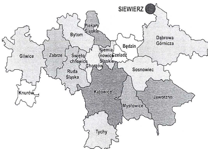
Ryc. 2. Górnośląski Związek Metropolitalny

* miasta pokazane na biało (Będzin, Czeladź i Knurow) nie weszły do Związku z powodu braku praw powiatu Źródło: http://pl.wikipedia.org/wiki/Górnośląski_Związek_Metropolitalny#column-one