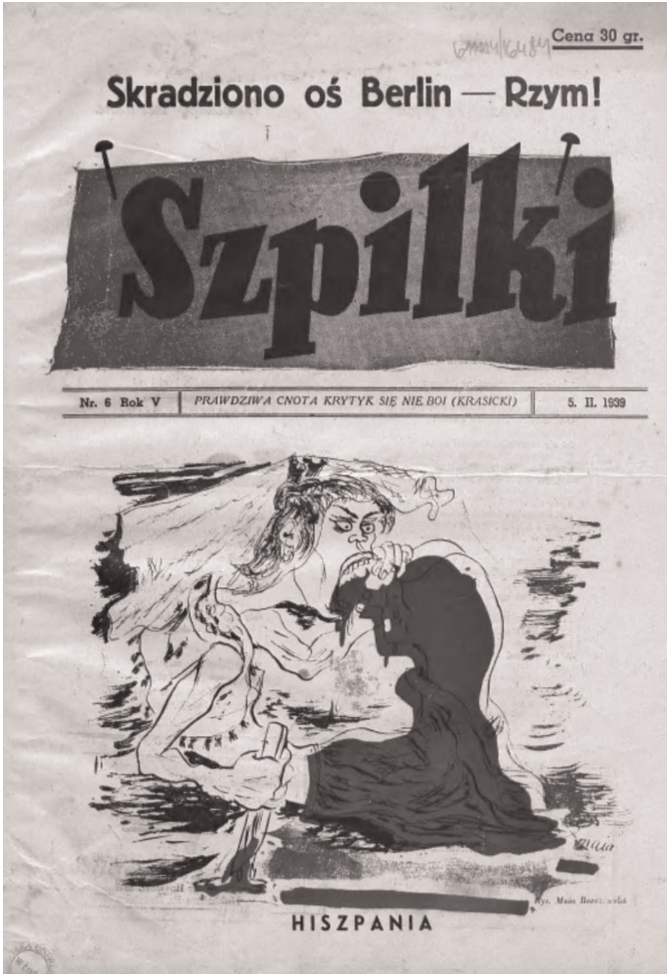
Ryc. 3. Ilustracja autorstwa Mai Berezowskiej zamieszczona na okładce czasopisma satyrycznego „Szpilki”