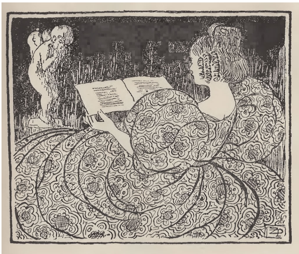
Ryc. 2. Ilustracja prasowa autorstwa Zofii Plewińskiej zamieszczana w czasopiśmie „Sfinks”