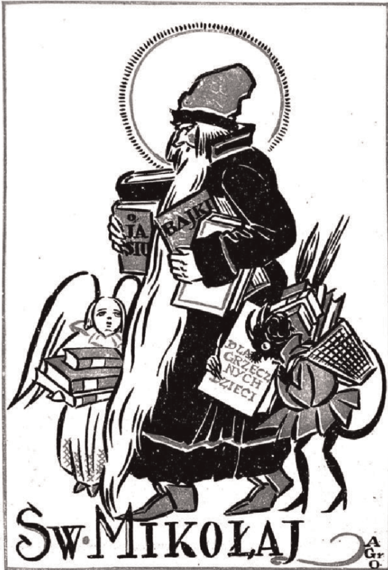
Ryc. 5. Ilustracja na okładce czasopisma „Moje pisemko” autorstwa Anny Gramatyki-Ostrowskiej