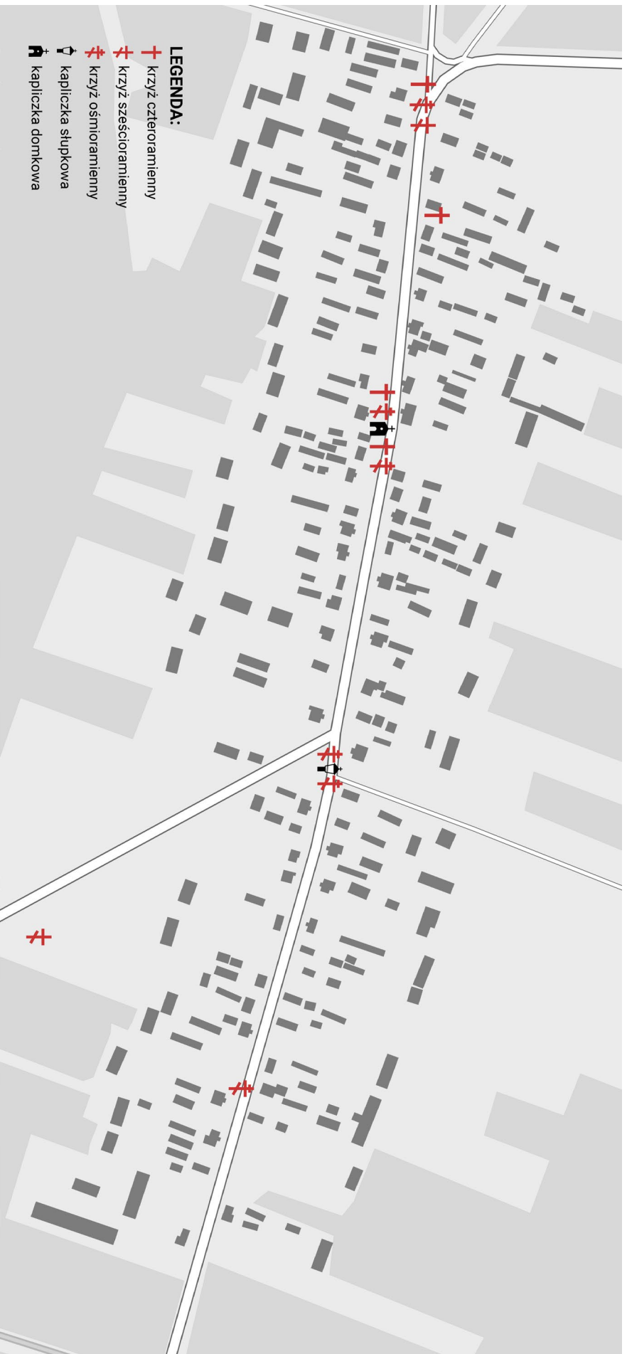
Il. 7. Arrangement of crosses and shrines in the landscape of the village of Kołty.