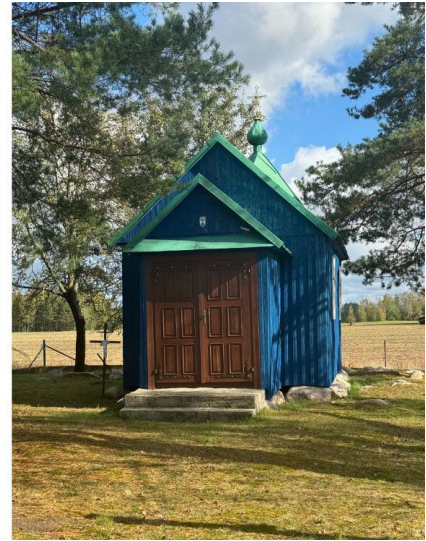
Ill. 5. A pillar shrine in the village of Klejniki, a house shrine in the village of Kojły, a shrine by a spring in the village of Kuraszewo.