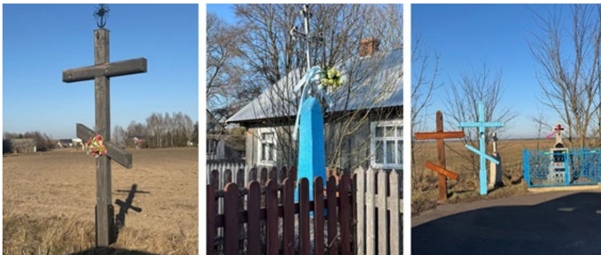
III. 3. Materials used in the construction of roadside crosses: wooden cross in the village of Kojły, stone-iron cross in the village of Podrzeczany, group of crosses in the village of Kamień.