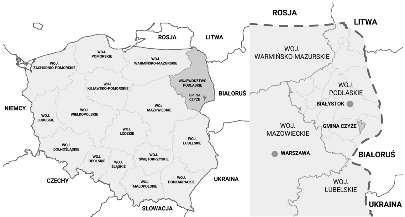
Ill. 1. Location of the study area in the administrative borders of Poland and in Podlaskie Voivodeship.