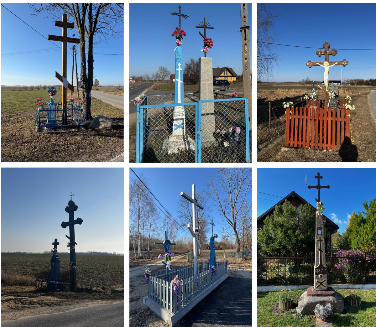
III. 4. Groups of roadside crosses in the villages of 1. Szostakowo, 2. Czyże, 3. Osówka, 4-5. Zbucz; 6. a house cross in the village of Czyże.