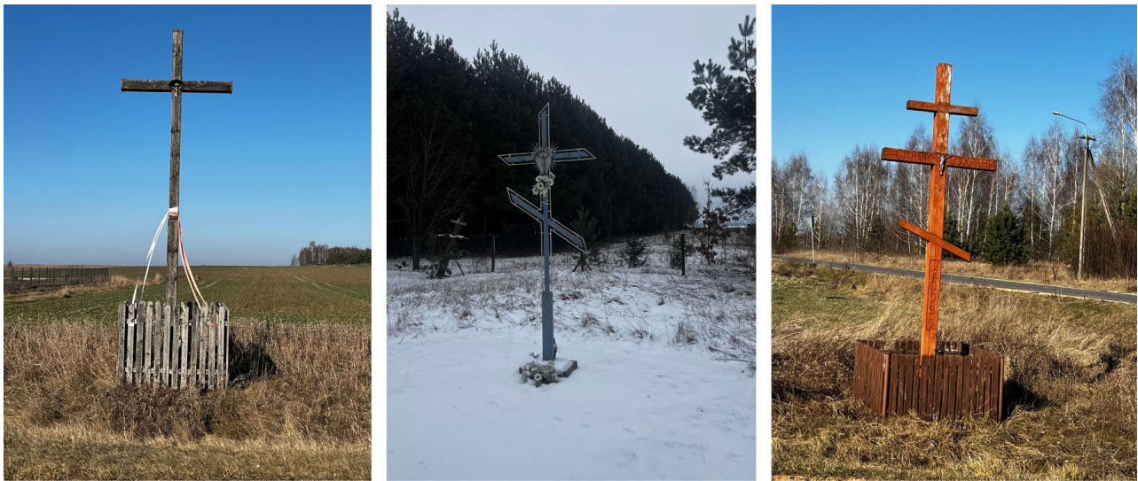
Ill. 2. Types of crosses found in the space of border villages: four-armed (Lady), six-armed (Morze), eight-armed (Kuraszewo).