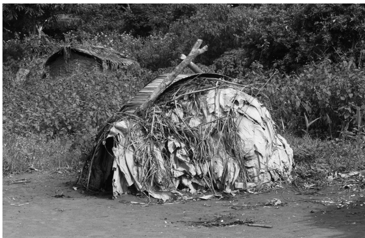
Scena ilustrująca warunki życia codziennego – przykład domostwa Ba’Aka na skraju wioski. Na ubogie warunki wskazuje stan i marginalne rozmieszczenie chaty w wiosce pigmejskiej, którą dziś zasiedlają inne grupy etniczne, spychając Pigmejów na obrzeża Republika Środkowoafrykańska , 2012.