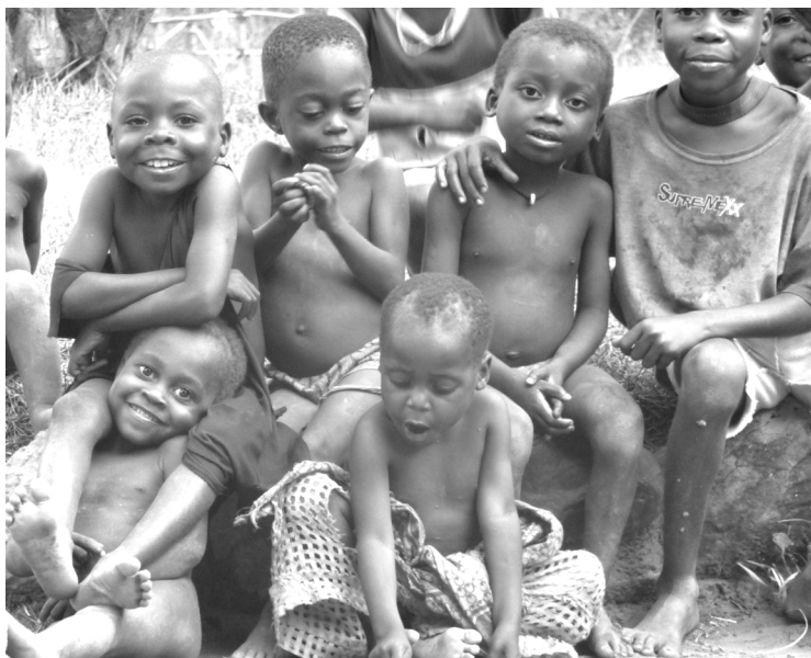
Scena z życia codziennego w wiosce: przykład sposobu spędzania czasu wolnego dzieci Ba'Aka w wieku przedszkolnym i wczesnoszkolnym. Na zdjęciu dzieci w centrum wioski, bez dostępu do oferty kulturalno-oświatowej i aktywizującej Republika Środkowoafrykańska, 2012.