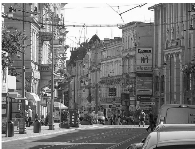
Fot. 2. Ulica Gdańska na wysokości wlotu ulicy Dworcowej. Wartościowa przestrzeń publiczna stanowiąca główną oś kompozycyjną miasta. Widok w kierunku Placu Teatralnego oraz rynku głównego miasta

W układzie przestrzennym śródmieścia ważną rolę odgrywa historyczna ulica Gdańska, jako przestrzeń publiczna (fot. 2, 3). Odgrywa rolę osi kompozycyjnej śródmieścia, położonego na północnym brzegu Brdy. Historycznie została wytyczona w latach 1816-1820. Stanowi arterię łączącą Stare Miasto z północnymi terenami bydgoskiej aglomeracji. W ukształtowaniu układu przestrzennego ulicy ważną rolę odegrało wytyczenie Placu Wolności oraz Alei Mickiewicza, które nadały jej reprezentacyjny charakter. Wartości estetyczne i unikatowe nadaje jej zróżnicowana stylowo zabudowa, jaka powstawała wraz z okresem tworzenia się ulicy (krajobraz architektoniczny kształtował się na przestrzeni ponad 150 lat) (Bręczewska-Kulesza 2003, s. 11-20). Do najważniejszych obiektów tworzących zabudowę o zróżnicowanej formie i znaczeniu należą obiekty wpisane do rejestru zabytków. Zaliczamy do nich: