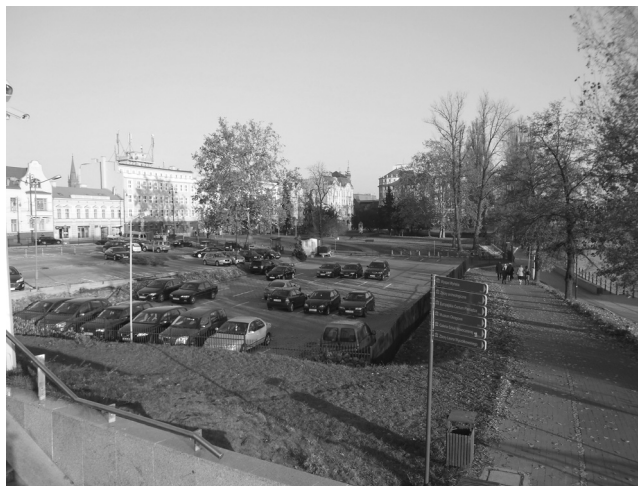
Fot. 6. Obszar niewłaściwego użytkowania przestrzeni między Operą Nova a Placem Teatralnym wprowadza duży dysonans w reprezentacyjnym fragmencie miasta

Kryterium degradacji funkcjonalnej – obecny sposób użytkowania jest niezgodny z rangą miejsca i wartościami kulturowymi, jakie pełnił w przeszłości. Na terenie placu widoczne jest obniżenie standardu użytkowania, co powoduje podwyższenie poziomu degradacji, współcześnie jest wyizolowany, nie jest miejscem aktywizacji społecznej. W obszarze placu widoczne jest tylko jego doraźne użytkowanie. Prowadzona działalność, która nie jest zgodna z rangą miejsca potęguje wysoki poziom degradacji. Zarówno teren Placu Teatralnego, jak i jego obrzeża obligują do zasadniczych zmian w sposobie użytkowania. Dotyczy to likwidacji parkingu postojowego przy ulicy Karmelickiej, jak i zagospodarowania nabrzeża na bulwary przy jego krańcu południowym (fot. 6).