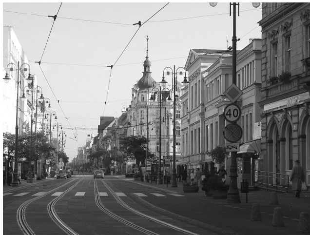
Fot. 3. Ulica Gdańska. Wnętrze prowadzące w kierunku Dzielnicy Muzycznej. Pierwszy plan prawej pierzei – sala koncertowa Akademii Muzycznej, na drugim planie Plac Wolności