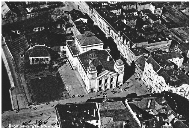
Fot. 5. Plac Teatralny z Teatrem Miejskim widok z lotu ptaka, ok. 1941 r.