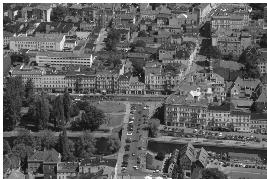
Fot. 8. Główna oś kompozycyjna miasta w kierunku północnym. Ul. Mostowa z „Mostem Królowej Jadwigi” wchodząca w ul. Gdańską. Plan pierwszy stanowi historyczna zabudowa przy nabrzeżu rzeki Brdy i ul. Marszałka F. Focha oraz fragment Placu Teatralnego. Odbiór społeczny znacznie obniża źle użytkowana przestrzeń publiczna