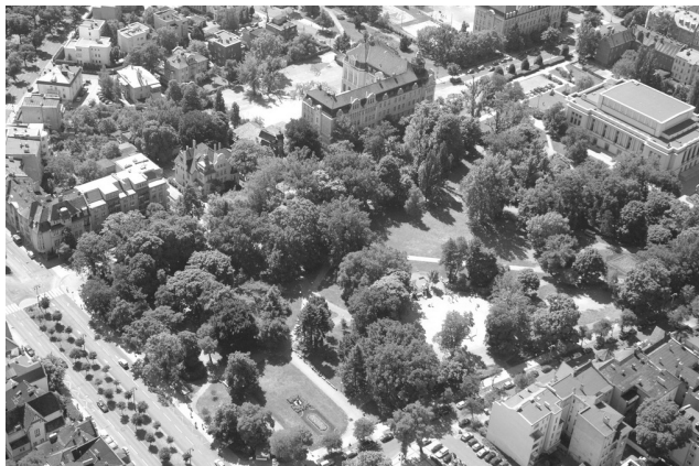
Fot. 4. Fragment Dzielnicy Muzycznej z parkiem J. Kochanowskiego, podkreślony od strony południowej – Filharmonią Pomorską im. I. Paderewskiego, od północy – Al. Mickiewicza z secesyjną zabudową, wschodniej – Copernicanum Uniwersytetu Kazimierza Wielkiego oraz zachodniej niewidoczna na rycinie Akademia Muzyczna im. F. Nowowiejskiego oraz Teatr Miejski im. H. Konieczki