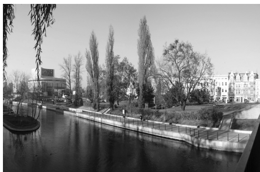
Fot. 7. Plac Teatralny z ulicy Mostowej. Przypadkowa zieleni, gubi reprezentacyjny charakter miejsca

Kryterium degradacji kompozycyjnej – stan degradacji obszaru należy określić jako średni. Plac Teatralny jest zlokalizowany przy głównej