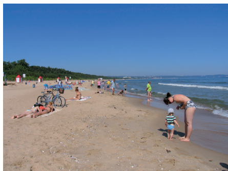
Fot. 17. Szeroka, piaszczysta plaża w Gdańsku jest unikatowa w skali europejskiej przynajmniej z jednego powodu. Prawie z niej nie widać miasta

stałych użytkowników. Park został wyposażony w dużą ilość atrakcji i urządzeń dla dzieci, młodzieży i dorosłych. Zbudowano 9 km ścieżek pieszo-rowerowych, zrealizowano system informacji o parku, tablice edukacyjne, placky zabaw dla dzieci i młodzieży, wybiegi dla psów. Zieleń i mała architektura podkreślają jego walory przyrodnicze i krajobrazowe. Park Reagana wygrał konkurs TUP na najlepszą przestrzeń publiczną woj. pomorskiego w 2006 r.