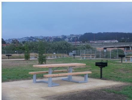
Fot. 6. Miejsca piknikowe dla osób indywidualnych i grup wyposażono w grille, siedziska oraz stoły