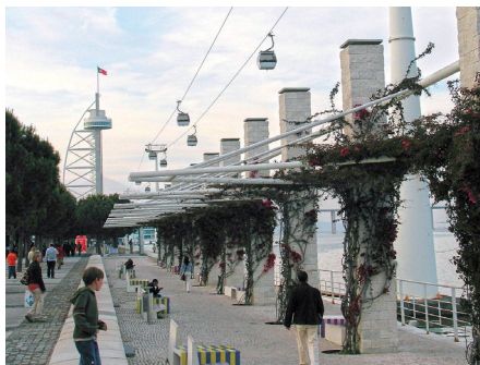
Fot. 2. Atrakcjami są kolejka linowa wzdłuż nabrzeża oraz wieża widokowa umożliwiające percepcję niezwykłego krajobrazu, w którym najważniejszym motywem jest woda