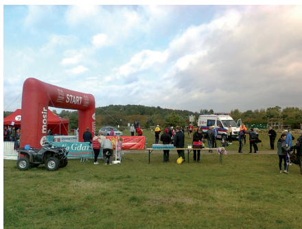
Fot. 18. Rozległe zielone tereny pasa nadmorskiego sprzyjają organizacji imprez masowych, m.in. zawodów Nordic Walking