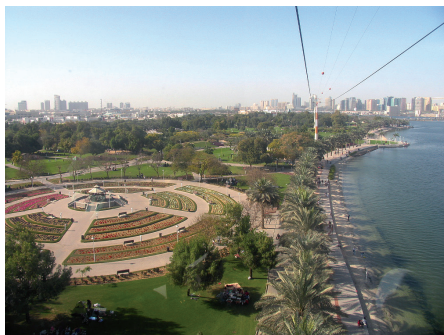
Fot. 9. Creek Side Park w Dubaju rozciąga się wzdłuż rzeki Dubai Creek na odcinku ok. 3 km. Na całej długości od strony rzeki ciągną się piaszczyste plaże

kolejne ulepszenia i elementy. Co jest podkreślane, projekt zrealizowano nie tylko dzięki twórczej wizji i hojności donatorów, ale też pracy wolontariuszy. Dlatego ten piękny seminaturalny park, jakże inny w wyrazie niż park miejski w Lizbonie, zadedykowano tym, którzy sprawili, że „marzenie o stworzeniu terenu zieleni i rekreacji w tym miejscu się urzeczywistniło”.