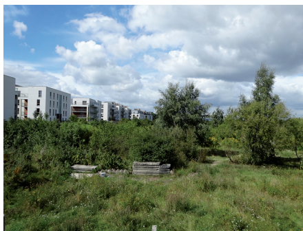
Fot. 20. Brzeźno. Nowe osiedle grodzone wzdłuż pasa nadmorskiego zapewnia piękne widoki na morze, ale zawłaszcza niezwyklej przestrzeń publiczną

Realizacja Parku Reagana nawiązała do zrodzonej jeszcze na początku XX w. koncepcji stworzenia wielkiego publicznego parku plażowego między Jelitkowem a Stogami. Jak pisze Rozmarynowska [2011, s. 286], w 1924 r.