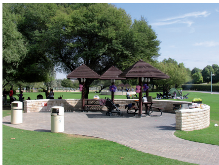
Fot. 11. Creek Side Park, Dubaj. Zacienione miejsca są w tym klimacie niezbędne