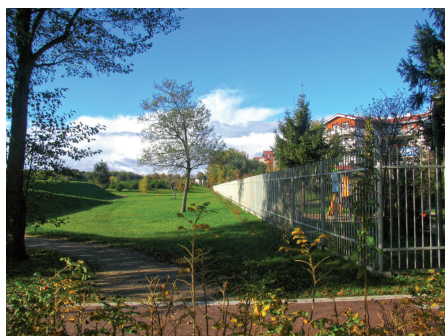
Fot. 19. Osiedle grodzone między Parkiem Reagana a morzem to typowy przykład podziału nie tylko przestrzeni, ale i społeczeństwa