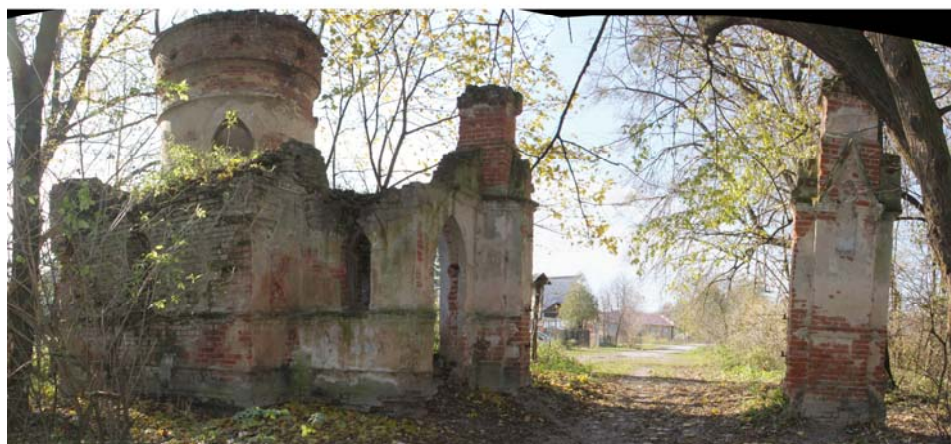
Ryc. 4. Plan i stan obecny bramy wjazdowej do Stryjowa