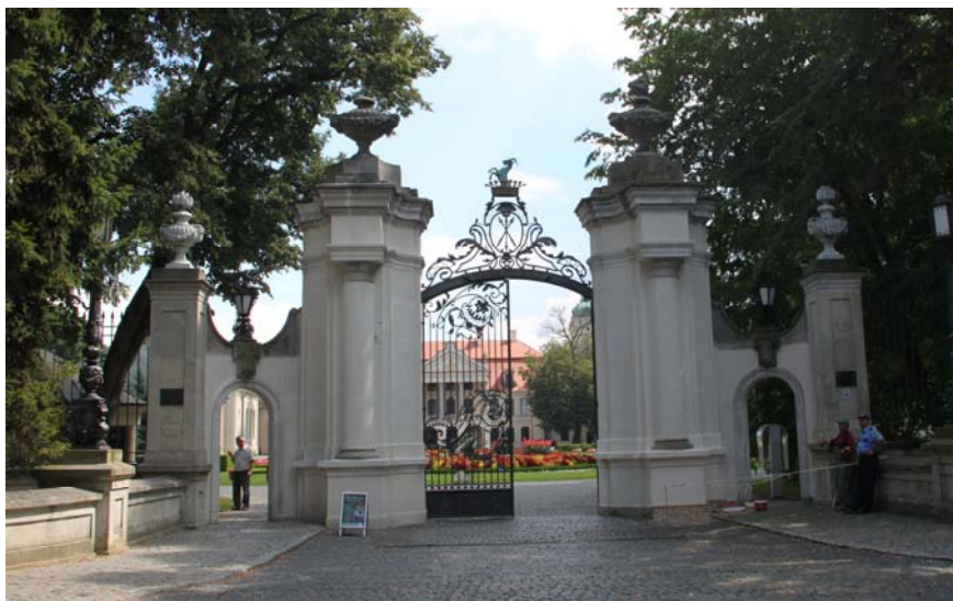
Ryc. 3. Neobarokowa Brama wjazdowa do Kozłówki Fig. 3. Neo-Baroque entrance gate to Kozłówka