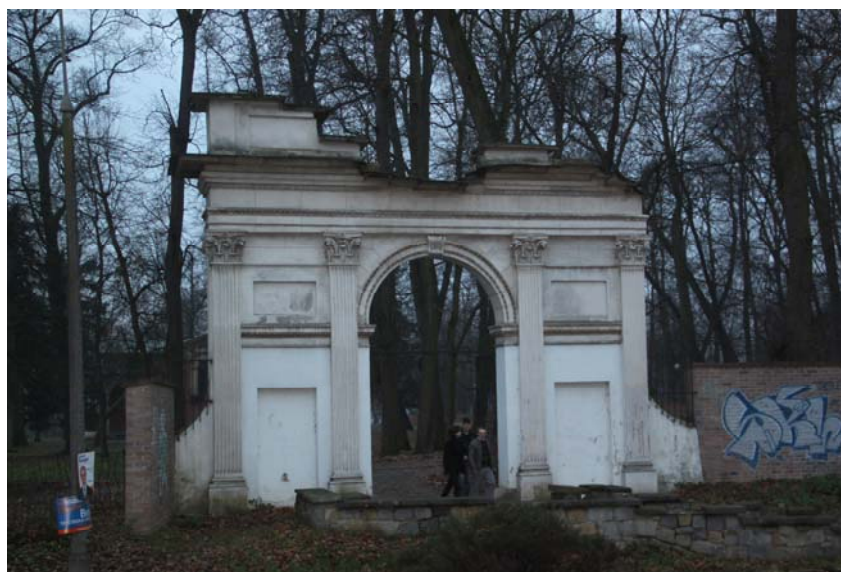
Ryc. 7. Łuk Triumfalny w Puławach