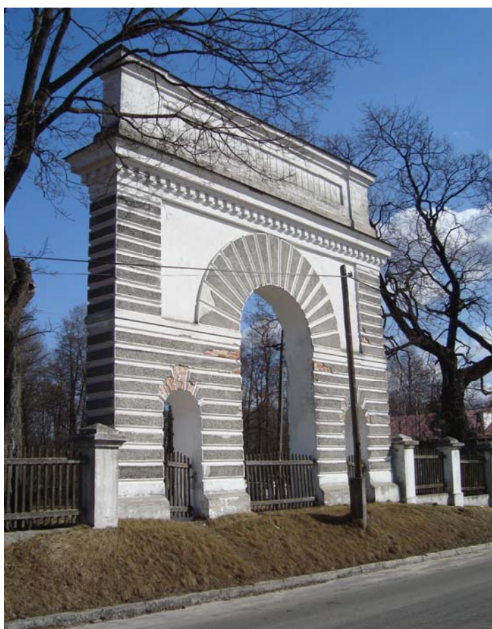
Ryc. 6. Łuk Trumfalny w Gościeradowie

Ostatnim typem bram były tzw. łuki triumfalne. Na Lubelszczyźnie zostały zbudowane w Gościeradowie i Puławach. Łuk w Gościeradowie usytuowany został w parku na zamknięciu alei. Jest to obiekt klasycystyczny, datowany na rok 1820 3 [Brykowski i in. 1971]. Brama triumfalna w Puławach powstała prawdopodobnie w XVIII w. z inicjatywy Izabeli Czartoryskiej. Autorstwo przypisywane jest J. Ch. Aignerowi. Brama miała nawiązywać do łuku rzymskiego [internet 2].