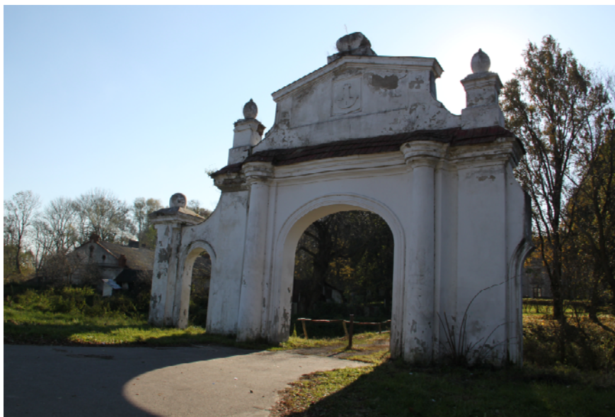
Ryc. 2. Późnobarokowa brama w Melgwi Podzamczu Fig. 2. Late Baroque gate in Melgiew Podzamcze