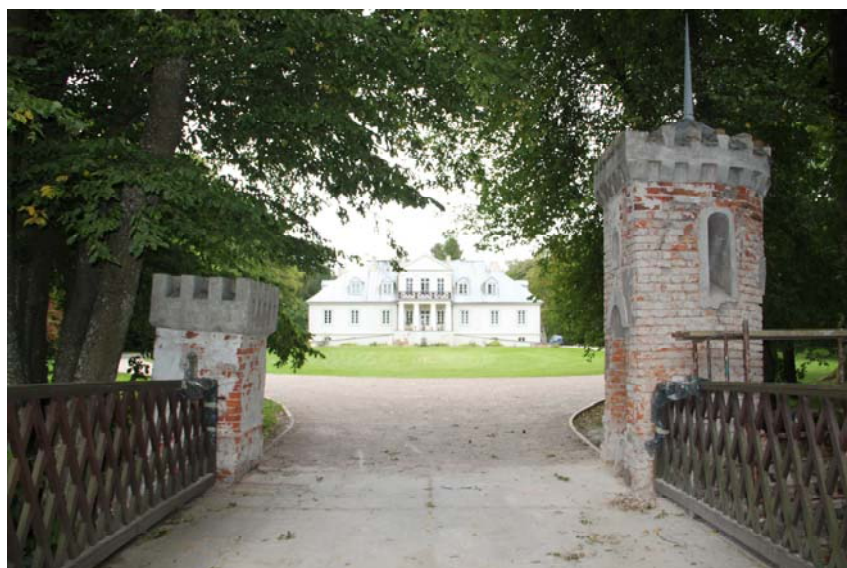
Ryc. 5. Brama wjazdowa do Romanowa, w tle pałac Kraszewskich

W mniejszych majątkach ziemskich budowano mniej okazałe bramy, czego przykładem jest jednoprzelotowa brama w Stryjowie. Połączona została ona ze stróżówką – kordegardą. Jest to obiekt neogotycki. Brama powstała pod koniec XIX w., została wymurowana z cegły i otynkowana. Szerokość przejazdu wynosi około 4 m. Domek stróża oparty jest na planie prostokąta z narożnie wpisana dwukondygnacyjną wieżą. Do chwili obecnej nie zachowała się więźba dachowa budynku, podobnie jak wrota bramne. Wymiary stróżówki kształtują się w granicach 6,6 \times 6 m. Obiekt posiada przedsionek i jednoprzestrzenne pomieszczenie połączone z wieżą. [Żywicki 1998]