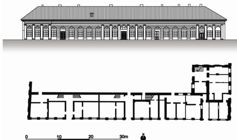
Ryc. 3. Oranżeria w Lubartowie po przebudowie w 1931 r. (oprac. K. Boguszewska)

Bryła oranżerii oparta była na planie wydłużonego prostokąta. Początkowo był to budynek parterowy, murowany z cegły, obustronnie otynkowany. Jedynie w części wschodniej posiadał dwie kondygnacje. W okresie międzywojennym popadał stopniowo w ruinę. W roku 1931 pomarańczarnia została odrestaurowana i adaptowana na funkcję mieszkalną, co spowodowało zmianę układu użytkowego obiektu. Wnętrze zostało całkowicie przekształcone, podzielone na dwie kondygnacje z sienią przelotową po środku [Brykowski i Smulikowska 1976]. Funkcję mieszkalną pełniła do końca lat 60. XX w. [Grytczuk i Kuźmicz 2001]. W następnych latach ze względu na zły stan techniczny wykwaterowano mieszkańców oranżerii.