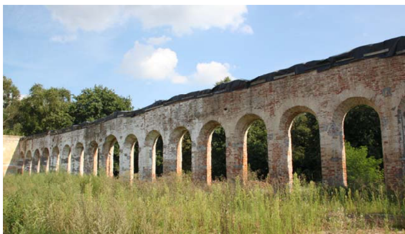
Ryc. 4. Oranżeria w Lubartowie stan rok 2011

W 2005 r. oranżeria została wystawiona przez władze miasta Lubartów na sprzedaż. Obiekt został wyceniony na kwotę około pół miliona złotych. Nieruchomość nabył lubartowski przedsiębiorca celem zaadaptowania pozostałości oranżerii na obiekt gastronomiczno-hotelarski 3 [internet 1].