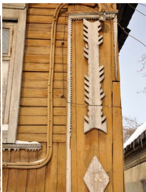
Ryc. 5. Samara przykład kożuchowania Fig. 5. Samara, corner example