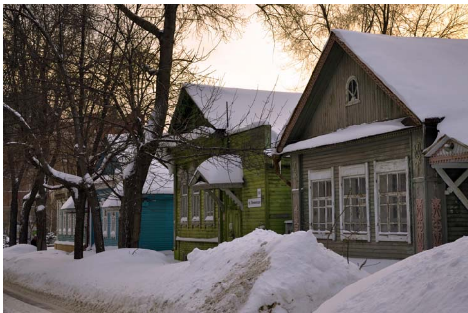
Ryc. 10. Samara fragment ul. Leninskaja 146–150

Dobrym przykładem może być rewaloryzacja fragmentu ul. Leninskaja 146–150 (ryc. 10). Są to jednopiętrowe domy, ustawione ścianą szczytową do ulicy. Każdy z tych domów został poddany konserwacji przy zachowaniu jak największej ilości oryginalnego detalu. Uzupelniono brakujące lub zniszczone