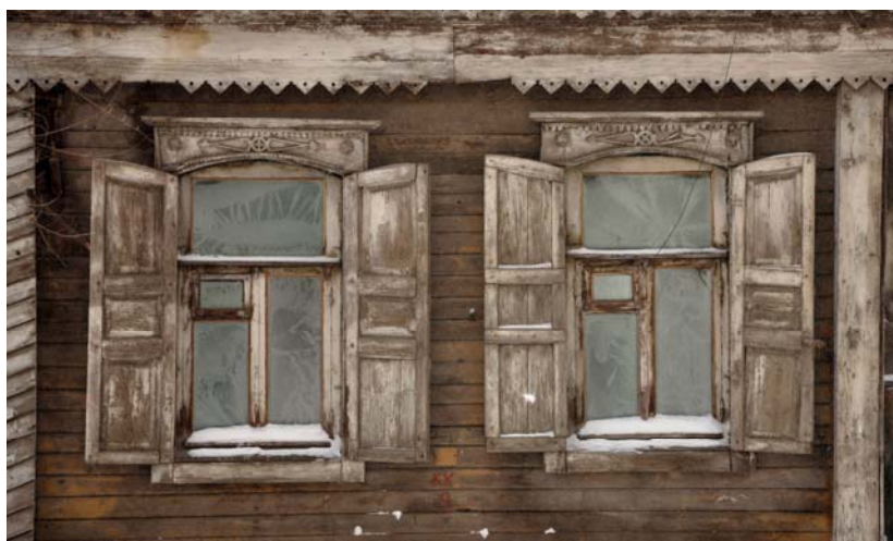
Ryc. 8. Samara przykład okiennic domu jednokondygnacyjnego

Okiennice. Mieszczanie, których nie stać było na wykonanie bogato dekorowanych nad- i podokienników, ozdabiali swoje elewacje okiennicami (ryc. 8). Również były używane jako element dekoracyjny na parterze (bardzo rzadko spotykany). Pierwotną funkcją okiennic była ochrona okien przed wiatrem i niskimi temperaturami, jednak dość szybko stały się elementem dekoracyjnym, detalem na elewacji domu. Rzadko posiadały ornament.