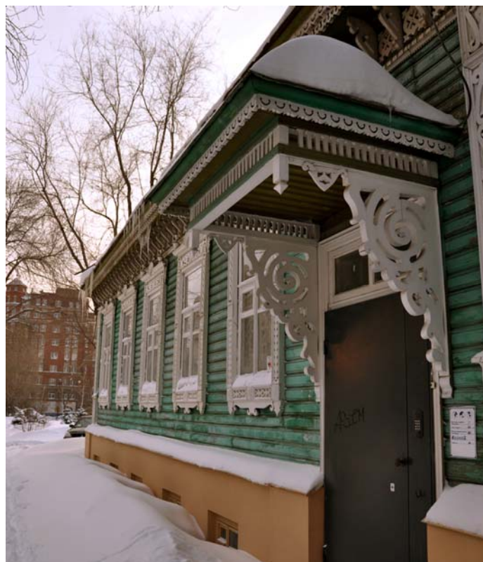
Ryc. 9. Samara dekoracja ganku ul. Leninskaja 146 Fig. 9. Samara, porch decoration, 146 Leninskaja Str.

Ganki. Charakterystycznym elementem rosyjskiej zabudowy ludowej są ganki (ryc. 9). Kształtują one formę całego budynku, akcentując wejście. Występowały one w najprostszym typie domu. Pierwotną ich funkcją było ochrona wejścia. Z czasem w zwartej miejskiej zabudowie zostały one zredukowane (w stosunku do ganków znajdujących się na wsi) do dachu okalającego wejście. Ganki zyskały jedynie charakter dekoracyjny. Zdobiono je motywami przede wszystkim roślinnymi oraz zoomorficznymi. Zadaszenie dekorowane było wiatrownicami z tym samym motywem jak wiatrownice na głównym dachu.