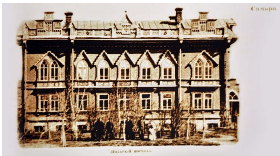
Ryc. 1. Pierwszy kościół polski w Samarze z początku XIX w.