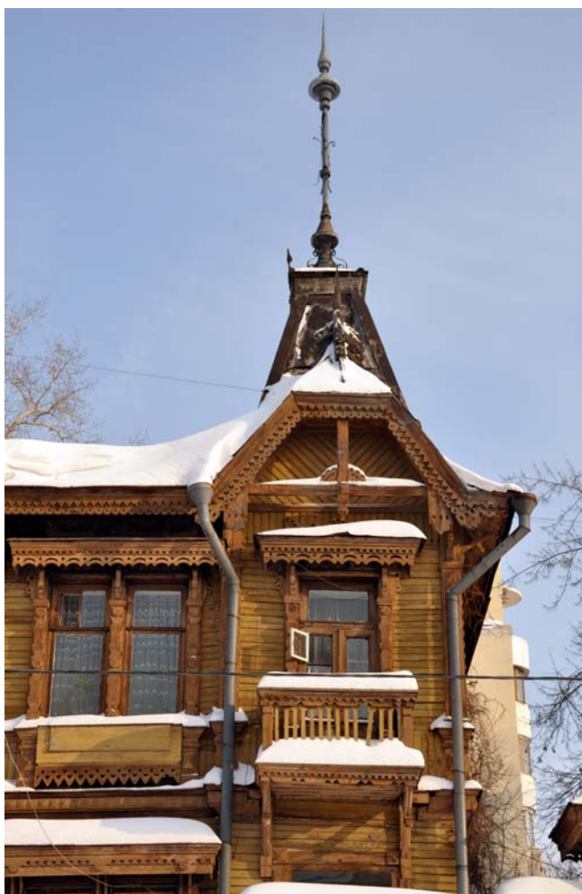
Ryc. 3. Samara dom przy ul. Frunze 171