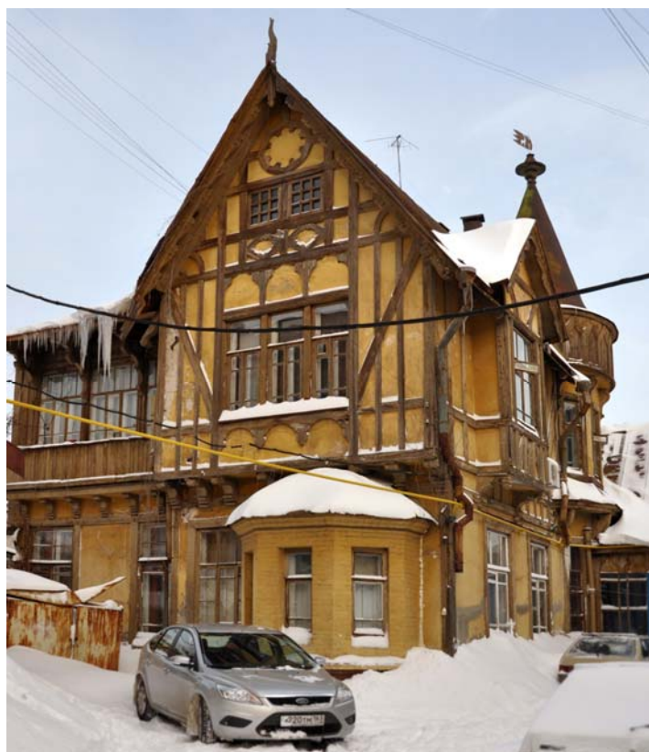
Ryc. 2. Samara dom przy ul. Frunze 75

Drewniane domy pochodzące z końca XIX w. i początku XX najczęściej budowano w konstrukcji zrębowej lub mieszanej: murowany parter, drewniane piętro (ten typ konstrukcji możemy spotkać w budynkach zamożnych mieszczan). Ściany zewnętrzne wykonywano w konstrukcji zrębowej na „jaskółczy ogon” lub „zamek zrębowy”. Natomiast sień, pomieszczenia gospodarcze oraz podziały wewnętrzne wykonywano w konstrukcji szkieletowej.