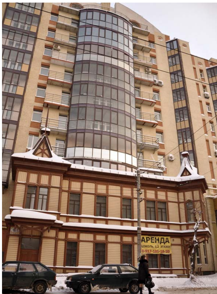
Ryc. 11. Samara widok z ulicy na nowo powstały wieżowiec