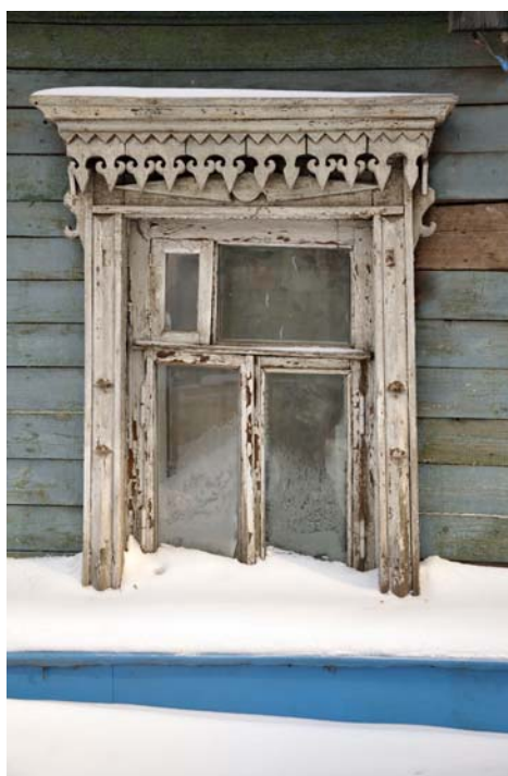
Ryc. 6. Samara przykład obramienia okiennego domu dwukondygnacyjnego