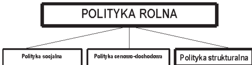
Rysunek 1. Podział polityki rolnej na różne przedsięwzięcia ze względu na charakter pomocy (opracowanie własne)

Podstawę opracowania stanowi analiza wybranych dostępnych materiałów dotyczących inwestycji i ocena ich wpływu na stan rozwoju rolnictwa i obszarów wiejskich w Polsce w aspekcie prowadzonej w okresie 1918–2008 polityki strukturalnej.