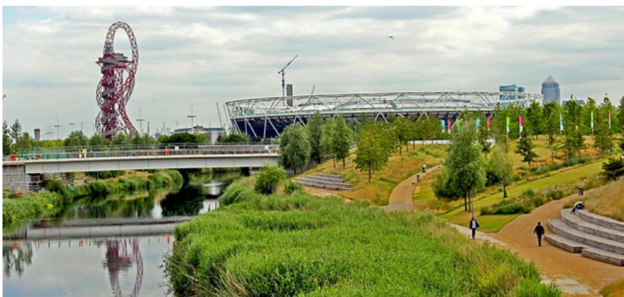
3. Queen Elisabeth Olympic Park.

240 mln funtów). Podkreślano, że utrzymanie będzie kosztowało milion funtów rocznie. Konstrukcja dachu przez swoją ekstrawagancką formę waży cztery razy tyle, co podobnej wielkości dach budowany nad olimpijskim welodromem, a budynek basenu emituje trzy razy więcej dwutlenku węgla do