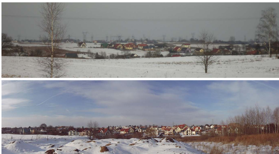
Ryc. 2. Panorama suburbii Lublina po północnej stronie miasta (za ul. Zbożową) i zachodniej (wylot ul. Nałęczowskiej) Fot. N. Przesmycka 2011

Bardzo duży wpływ na kierunki rozwoju zabudowy podmiejskiej i zjawiska suburbanizacji będą mieć dla Lublina realizowane inwestycje infrastruktury transportowej (lotnisko w Świdniku, obwodnica drogi krajowej nr 17). Jak zmienią się funkcjonalnie i przestrzennie obszary suburbii po realizacji obwodnicy? Czy będzie stanowić ona dla nich granicę, barierę, czy może nic nie zmieni? Jak zmienią się ceny gruntów przed i za obwodnicą, przy zjazdach. Może po realizacji nowych dróg mieszkańcy docenią wagę zieleni jako izolacji? Te pytania można zadać sobie, analizując kierunki rozwoju przestrzennego zabudowy suburbii.