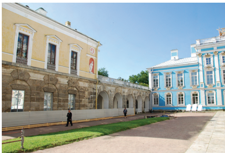
Ryc. 7. Pałac Katarzyny I, od lewej Agatowe Komnaty, Wiszący Ogród, Zubowskie Skrzydło

samej Katarzyny. Carya wysłała też do Anglii swoich ogrodników, którzy tam przeszkoleni mieli doglądać roślin. Ten fragment parku zachwyca malowniczością. Drzewa i krzewy zakomponowane zostały tak, aby harmonizowały kolorystycznie w każdej porze roku. Znajdowały się tutaj obiekty (pomniki, mostki i pawilony), które miały przypominać o wyprawach wojennych Katarzyny II. Granicą pomiędzy parkami Jekaterińskim a Aleksandrowskim była droga (zwa-