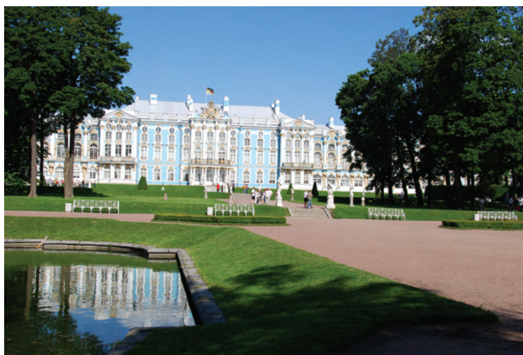
Ryc. 2. Pałac Katarzyny I, fasada, widok od strony Ogrodu Francuskiego