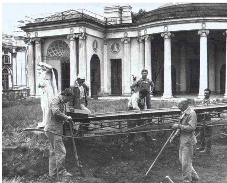
Ryc. 9. Pałac Katarzyny I, zdejmowanie ziemi z Wiszącego Ogrodu (rok 1988), w tle Agatowe Komnaty