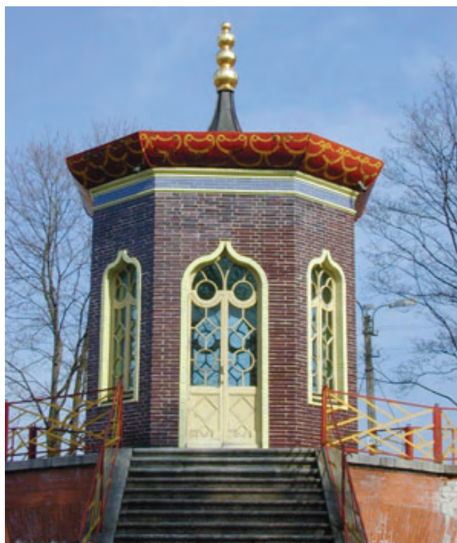
Ryc. 20. Krzyżowy Most, chińska altanka. Widok po konserwacji.