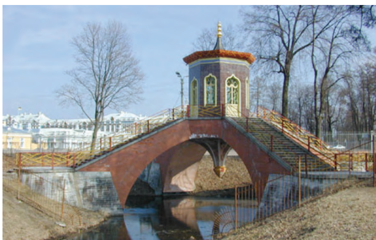
Ryc. 18. Krzyżowy Most. Widok po konserwacji