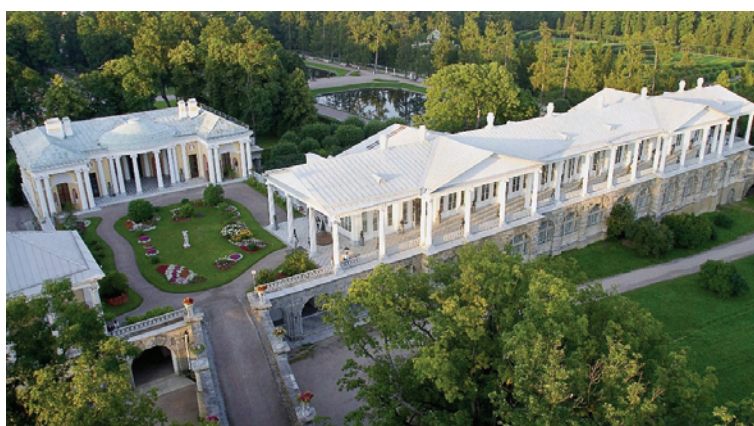
Ryc. 8. Pałac Katarzyny I, Wiszący Ogród, widok na Agatowe Komnaty

Fig. 7. The Palace of Catherine I, from left: Agate Rooms, Hanging Garden and Zubov Wing