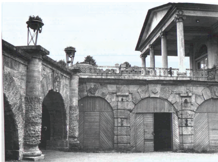
Ryc. 12. Pandus, widok na Galerię Camerona (fot. 1988, M. Wilczkiewicz)