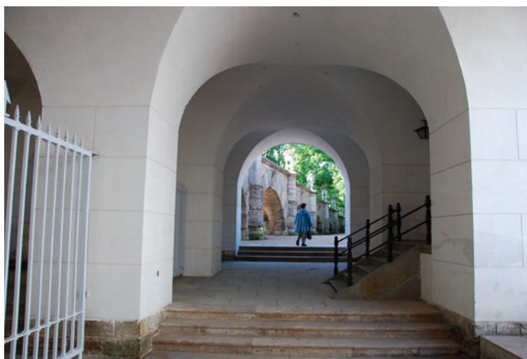
Ryc. 11. Wiszący Ogród, stan po konserwacji

Za Jekaterińskim Parkiem znajduje się Park Aleksandrowski, założony wraz z wybudowanym pałacem dla wnuka Katarzyny II, Aleksandra. W pałacu tym w roku 1917 został uwięziony na okres pięciu miesięcy ostatni car Rosji, Mikołaj II wraz z rodziną.