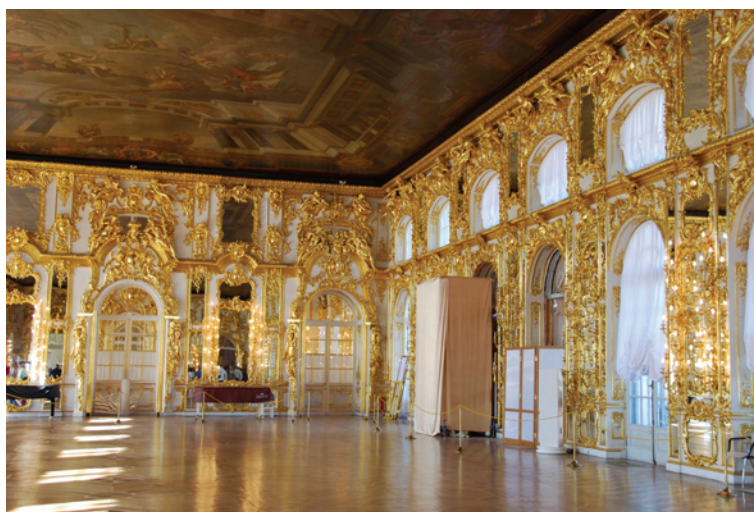
Ryc. 5. Pałac Katarzyny I, sala balowa (fot. 2010, Raul O. Castro)