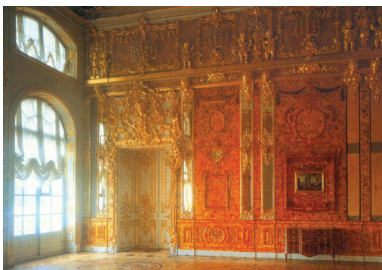
Ryc. 6. Pałac Katarzyny I, Bursztynowa Komnata (rekonstrukcja)