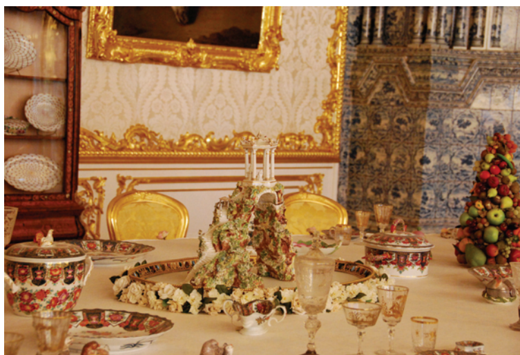
Ryc. 14. Pałac Katarzyny I, jadalnia. Porcelanowy model Wielkiego Kaprysu (fot. 2010, Raul O. Castro)