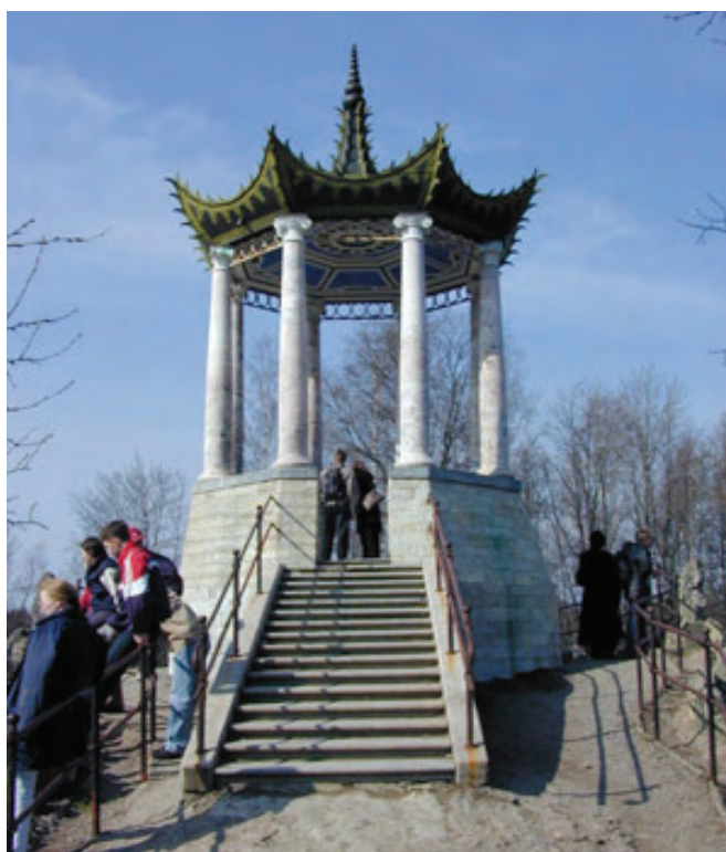
Ryc. 16. Wielki Kaprys, chińska altanka na szczycie ( http://www.eng.tzar.ru )

frustrację projektantów, a często skutkowało niewłaściwym rozwiązaniem projektowym. Pracownia projektowa została zorganizowana w prywatnych apartamentach Katarzyny (pokoje te nie były jeszcze odrestaurowane, choć reprezentacyjne sale pałacu już były udostępnione dla zwiedzających). Prace rozpoczęto od zdejmowania ziemi z Wiszącego Ogrodu, aby wymienić ołowianą izolację, która po ponad dwustu latach użytkowania niestety przeciekała. Część ekipy skuwała zawilgocone tynki ze sklepienia opartego na słupach podtrzymujących konstrukcję. Należało osuszyć estakadę, wymienić izolację i ponownie napęścić taras humusem, co – jak wspomniano – powinno być wykonane przed sezonem zimowym. Rosjanie podpisali umowę na wykonywanie prac według typowania robót, bez wymaganej przy tego typu obiektach dokumentacji wstępnej – badawczej. Zgodnie z zasadami obowiązującymi przy pracach konserwatorskich ziemię wybieraną z tarasu przesiewano, a znalezione artefakty przekazywano do dyspozycji muzeum. Oprócz fragmentów zastawy stołowej znaczonej swastykami a pochodzącej z niemieckiej kantyny (okres II wojny światowej) znaleziono odłamki grubego fioletowego szkła, pochodzącego ze szklanej altanki (wspomnianej już w artykule), która została roztrzaskana podczas działań wojennych.