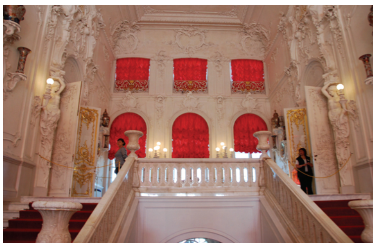
Ryc. 3. Pałac Katarzyny I, hall główny (fot. 2010, M. Wilczkiewicz)