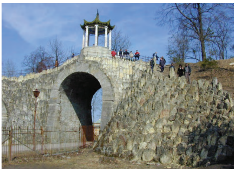
Ryc. 15. Wielki Kaprys ( http://www.eng.tzar.ru )