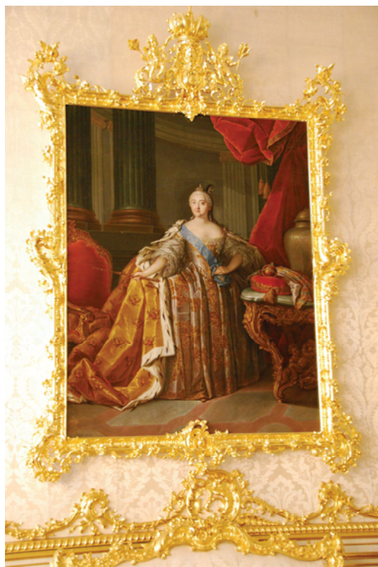
Ryc. 4. Pałac Katarzyny I, portret Katarzyny II, hall główny

budowlanej. Wyjście z nich prowadziło bezpośrednio na Wiszący Ogród. Ogród znajdujący się na estakadzie słupów, uniesiony ok. 8 m nad poziomem terenu, był miejscem, gdzie Katarzyna wypoczywała po kąpeli, chroniąc się przed słońcem w altance wybudowanej z tafli fioletowego szkła 7 . Za czasów Katarzyny rosły na nim krzewy różane oraz jaśminowe. Od zachodu Wiszący Ogród łączył się bezpośrednim wejściem z Galerią Camerona. Na tarasach Galerii znajdowały się rzeźby, były to popiersia sławnych Rosjan, a także Diderota i Voltaira. Katarzyna żywo interesowała się filozofią francuskiego oświecenia i czytała obu autorów oraz korespondowała z Voltairem. Ostatnim elementem dodanym do kompozycji Wiszącego Ogrodu był Pandus, czyli pochylnia. 60-letnia Katarzyna chorowała na nogi i nie mogąc schodzić o własnych siłach do prywatnej części parku, która znajdowała się poniżej Wiszącego Ogrodu, poleciła wybudować kamienną pochylnię (Pandus) łączącą Wiszący Ogród z parkiem.