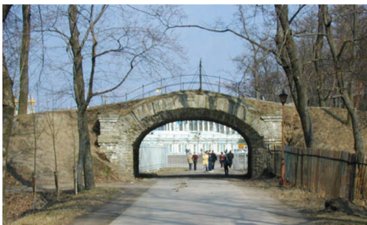
Ryc. 17. Park Aleksandrowski, Podkapisowaja Droga. Mały Kaprys