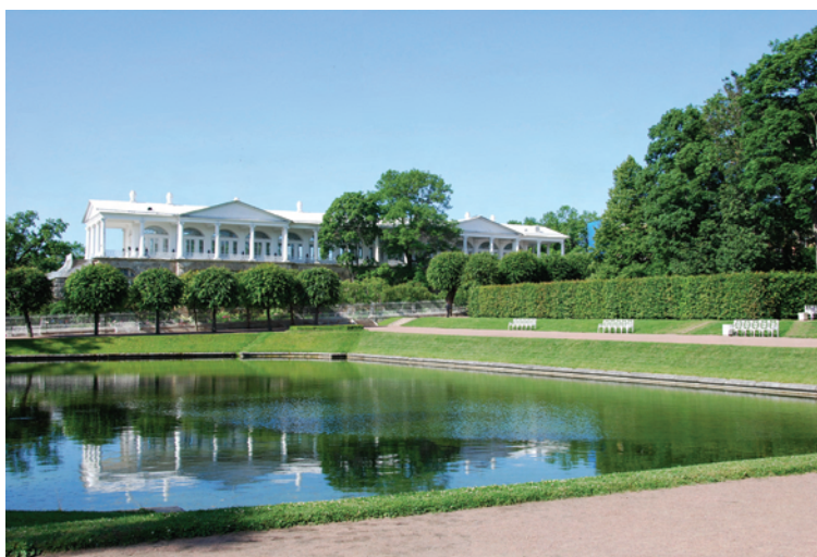
Ryc. 13. Galeria Camerona, widok od strony Ogrodu Francuskiego (fot. 2010, M. Wilczkiewicz)