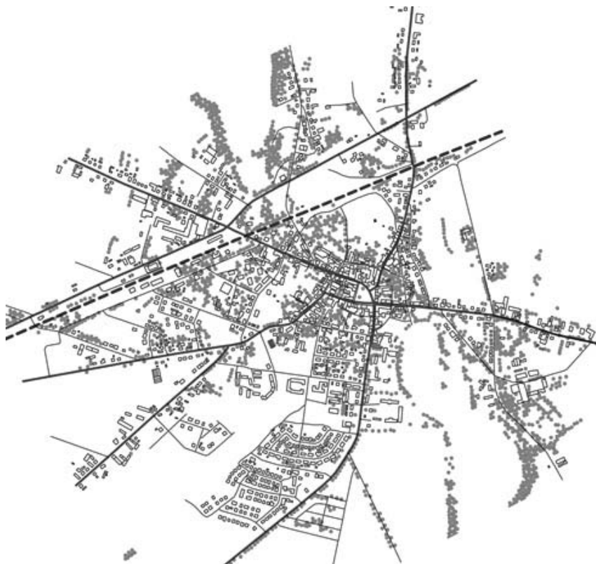
Ryc. 1. Zabudowa miasta Pobiedziska (powiat poznański). Umieszczenie rynku w strukturze miasta

budowy mieszkaniowej, tereny usług, tereny zieleni zorganizowanej, a dalej tereny działalności gospodarczej, lasy i użytki rolne. Wszystkie obszary łączy rozległy układ komunikacyjny. Najbliższa zabudowa jednorodzinna, wielorodzinna i zagrodowa występuje w formie pojedynczych obiektów lub zorganizowanych zespołów zabudowy. Jednorodzinna jest uboga w przestrzeń publiczną i formuje się w postaci kwartałów mieszkaniowych między gęstą siecią ulic. Budynki są chaotycznie rozlokowane wewnątrz kwartału zabudowy, są uzupełnione zielenią. Zabudowa powstała po 1990 r. znajduje się dalej od rynku, tworzy zwarte i uporządkowane osiedla mieszkaniowe lokalizowane na południowych i południowo-wschodnich obrzeżach miasta lub uzupełnia istniejącą strukturę. Geometria ulic tych osiedli jest czytelna. Zabudowa uzupełniona jest zielenią w formie pojedynczych zadrzewień. Gęsty podział terenu i uregulowania obowiązujące na tych osiedlach planu zagospodarowania przestrzennego uniemożliwiają swobodne wykorzystanie powierzchni działki. Średnia jej wielkość wynosi 1000-1500 m 2 . Osiedla te nie mają przestrzeni wspólnych, zorganizowanych, zachęcających do kontaktów społecznych.