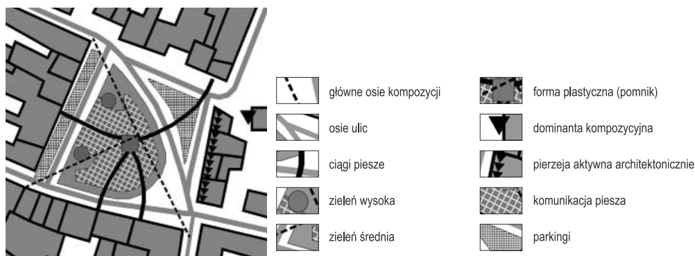
Ryc. 3. Rynek w Pobiedziskach (powiat poznański). Analiza kompozycji wnętrza urbanistycznego

Dzisiejsze rynki czy place pozostają miejscami koncentracji różnego rodzaju aktywności społecznej, spotkań czy manifestacji. Nie należy więc przekształcać wnętrza rynkowego w park czy zielony zagajnik, nie można również zmieniać go na dworzec autobusowy czy duży asfaltowy parking. Rynek w Pobiedziskach jest przestrzenią publiczną o urozmaiconej funkcji, zmieniającej się z porą dnia i roku, dającej mieszkańcom swobodę wyboru i niosącej wartości emocjonalne, często związane z wydarzeniami historycznymi. Jest zatem miejscem z tożsamością, o wysokim stopniu identyfikacji społecznej, z atrakcyjnymi dla odbiorców formami przestrzennymi. Jest też dla mieszkańców obszarem centralnym, najważniejszym punktem, w którym miasto się zaczęło i który decyduje o kształcie całego organizmu miejskiego. Jest dostępny komunikacyjnie, czytelnie powiązany przestrzennie z pozostałą zurbanizowaną częścią, stanowi punkt orientacyjny miasta.