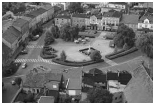
Fot. 1, 2. Rynek w Pobiedziskach (powiat poznański)