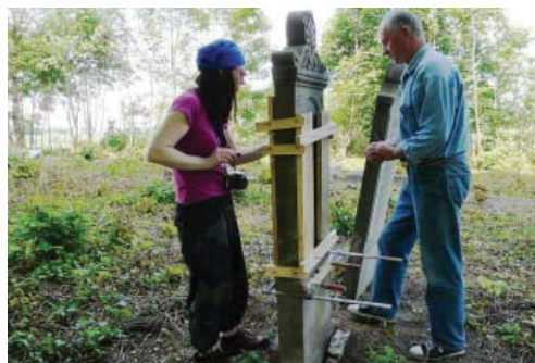
Fot. 11. Cmentarz w Mirowie