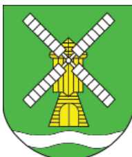
8. Gmina Ostaszewo