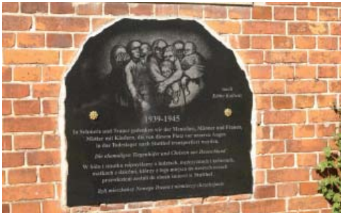
Fot. 3. Tablica na stacji kolejowej w Szymankowie