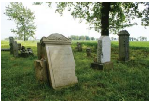
Fot. 10. Uporządkowane lapidarium w Pordenowie