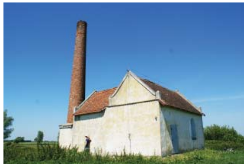
Fot. 9. Dawna stacja pomp we wsi Różany

opisem historii powstania danego obiektu postawione zostały dzięki Stowarzyszeniu „Łączy nas Kanał Elbląski”, a współfinansowane były m.in. przez Unię Europejską.