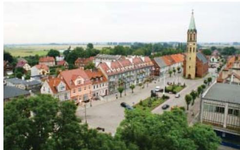
Fot. 4. Rynek w Nowym Stawie z dawnym kościołem ewangelickim

znaczenia w przestrzeni społecznej. W tym miejscu zasadne wydaje się powtórzenie pytania za socjologami śląskimi: Jak daleko należy sięgać w przeszłość dla wyjaśniania współczesnych zróżnicowań, nie tylko (...) krajobrazu kulturowego, ale także struktur gospodarczych i społecznych? [Jałowicki et al. 2007, s. 115]. Historia i odwołania do niej są jednak nadal ważnym (jeżeli nie najważniejszym) czynnikiem wpływającym na kształtowanie się regionalnej kultury żuławskiej.