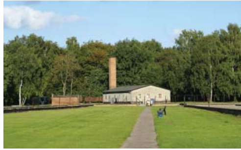
Fot. 2. Krematorium w Muzeum Stutthof Fot. A. W. Brzezińska (fot. 2-10).