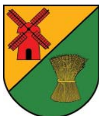
4. Gmina Lichnowy