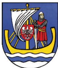
1. Gmina Stegna