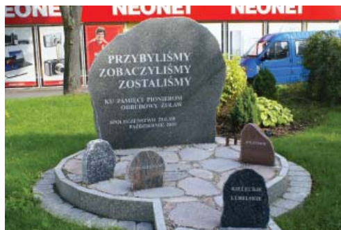
Fot. 7. Pomnik Osadników w Nowym Dworze Gdańskim

Do symboli lokalnych, związanych z konkretnymi miejscowościami można zaliczyć pamięć o postaciach historycznych pochodzących z konkretnych miejscowości (bl. Dorota z Mątówów Wielkich, gm. Miłoradz) lub bytności sławnych postaci (generał Józef Bem i powstańcy listopadowi w Fiszewie, gm. Stare Pole). Za ważne wydarzenia historyczne badani uznali także te związane z II wojną światową, jak: funkcjonowanie KL Stutthof (obecnie Muzeum Stutthof w Sztutowie) wraz z podobozami na terenie Żuław, „marsz śmierci”, pomnik zamordowanych celników w Szymankowie, spalenie kościoła katolickiego w Ostaszewie przez wycofujące się wojska niemieckie (fot. 6), a także przybycie pierwszych nowych osadników po 1945 r. (upamiętnieniem tego wydarzenia jest m.in. postawiony w Nowym Dworze Gdańskim Pomnik Osadników, fot. 7).