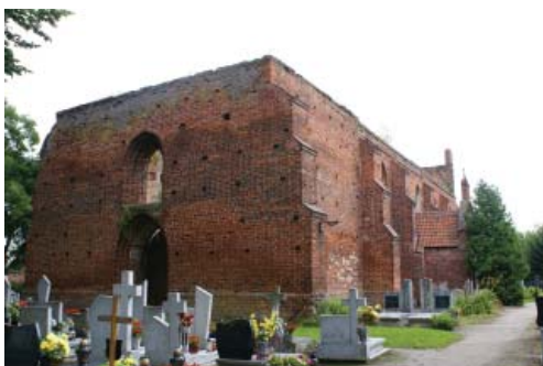
Fot. 6. Ruiny kościoła w Ostaszewie