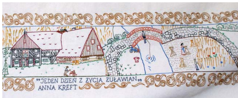
Fot. 5. Praca zbiorowa mieszkanek Żuław – fragment makatki przedstawiającej historię i kulturę Żuław

kazu kulturowego w nowo przybyłych grupach osadników. Podstawowym założeniem badań było przekonanie o nadrzędnej roli rodziny w przekazywaniu wiedzy kulturowej. Rodzinny charakter migracji pozwolił na przeniesienie rodzin z poprzedniego miejsca zamieszkania bez naruszenia w niektórych ich grupach struktury i z zachowaniem poważnej części wyposażenia kulturowego. Jednocześnie wędrówki rodzinami spowodowały daleko idące przemieszanie rodzin z różnych społeczności lokalnych i grup regionalnych. W tych warunkach, na nowym miejscu zamieszkania, rodzina ujawniła się pod postacią grupy reprezentującej odrębne wzory kultury regionalnej czy etnicznej, z biegiem czasu dopiero zatracającej cechy kulturowe różniące ją od innych rodzin społeczności lokalnej [Jasiewicz 1972, s. 36]. Pozwalało to zatem nowo przybyłym na zachowanie własnego dziedzictwa kulturowego, jednocześnie będąc (przynajmniej początkowo) czynnikiem hamującym budowanie nowych więzi interetnicznych i interregionalnych. Jednak w stopniowym procesie adaptacji do nowych warunków geograficznych, społecznych i kulturowych zaczęły powstawać więzi lokalne.