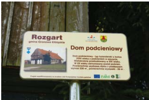
Fot. 8. Tabliczka informacyjna we wsi Rozgart