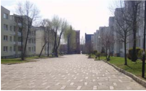
Fot. 1. Stare Miasto w Malborku