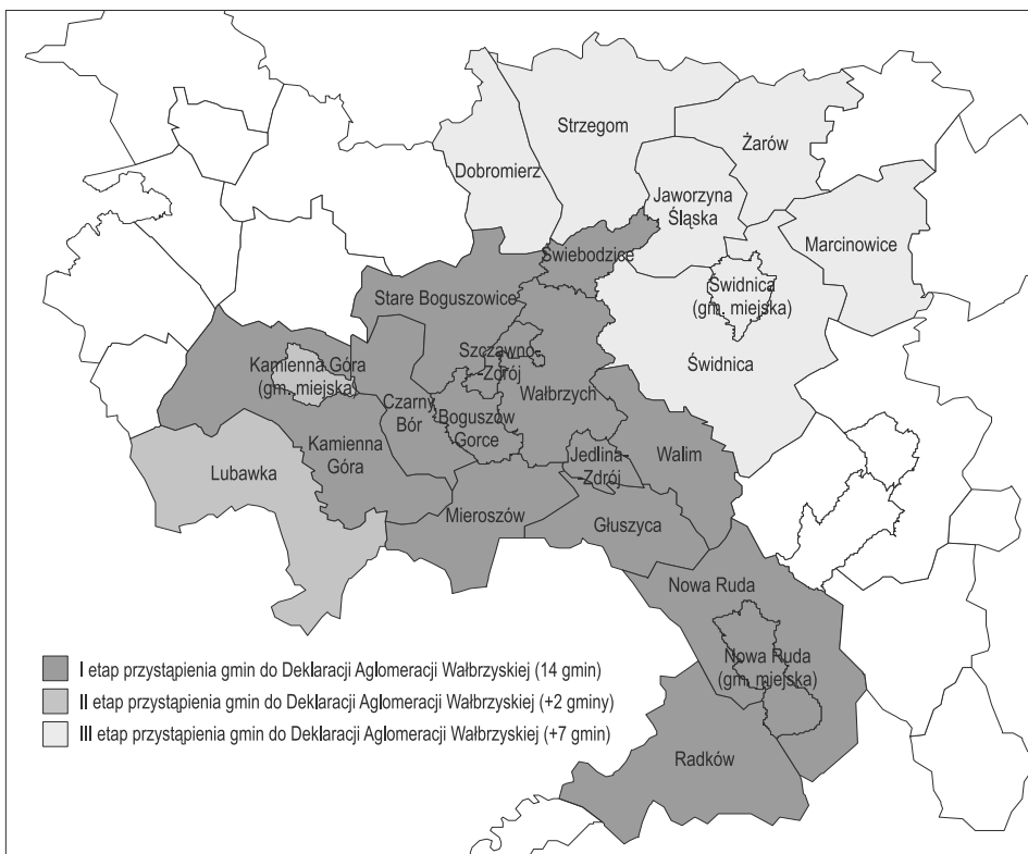
Ryc. 1. Etapy przystąpienia miast i gmin do Deklaracji Aglomeracji Wałbrzyskiej